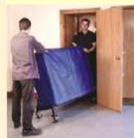
Facilité de déplacement